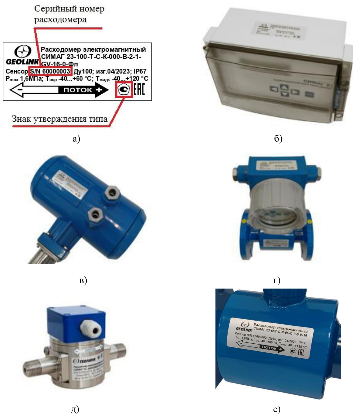
Рисунок 5 – Вид маркировочной этикетки и места ее нанесения: а) вид маркировочной этикетки; б) этикетка на электронном блоке отдельного и комбинированного исполнения; в) этикетка на электронном блоке компактного исполнения вариант 1; г) этикетка на электронном блоке компактного исполнения вариант 2; д, е) этикетка на сенсорах.

Серийный номер расходомера в виде набора арабских цифр наносится типографским способом на маркировочных этикетках рисунок 5,а, закрепляемых на боковой стороне сенсора и электронного блока, как показано на рисунке 5,б – 5,е. Нанесение знака поверки на расходомеры не предусмотрено.