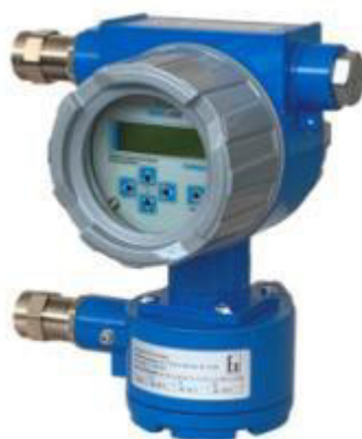
Рисунок 2 – Общий вид электронных блоков расходомеров раздельного исполнения