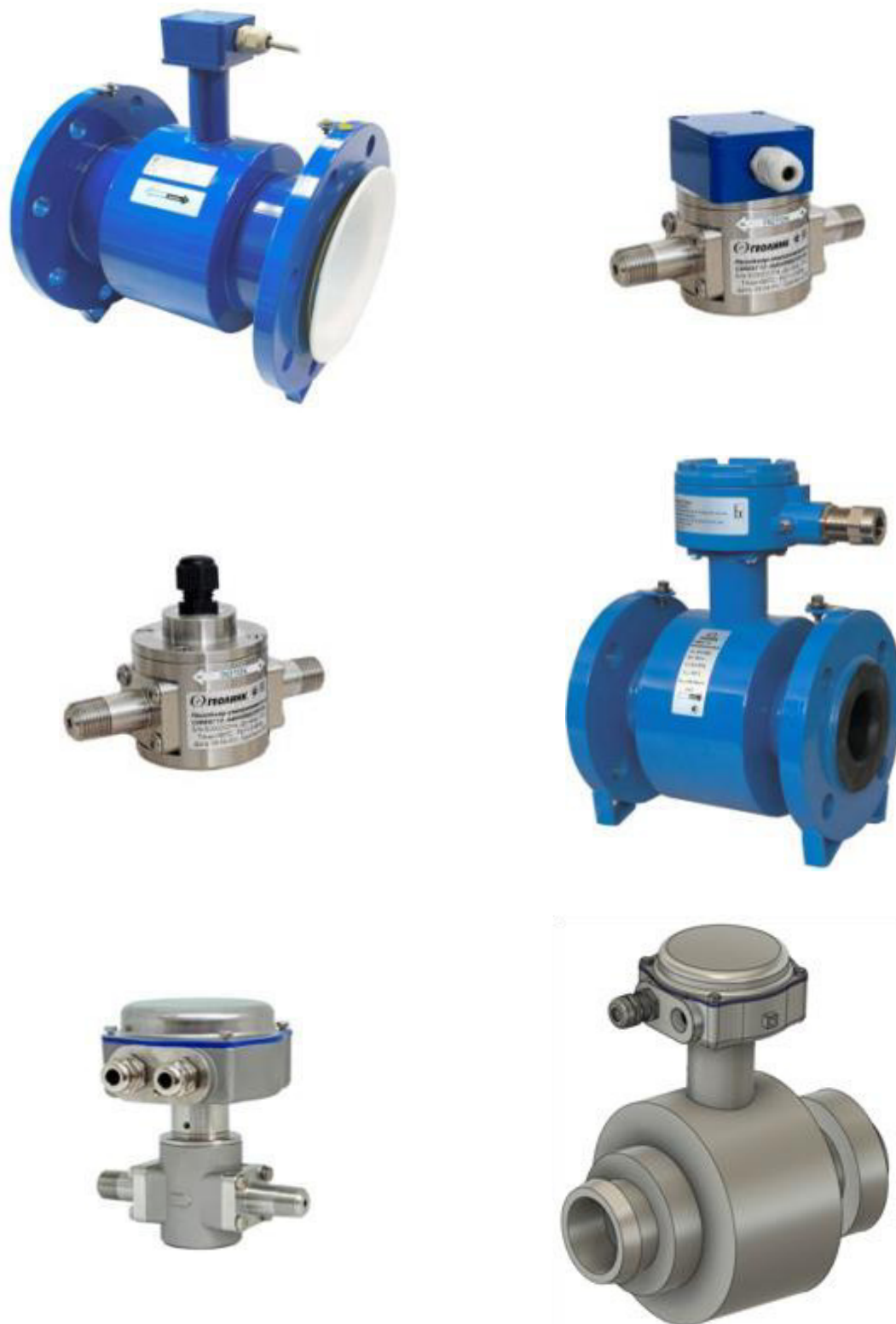
Рисунок 3 – Общий вид сенсоров раздельного исполнения.